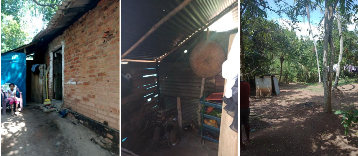
Außen-Küche & Außen-Toilette

Situation 2018: Die Verwandten sind in finanziellen Schwierigkeiten und müssen Haus und Grundstück möglichst kurzfristig verkaufen. Die Familie müsste in ein anderes Domizil umziehen; sie möchte jedoch gern dort bleiben, weil die Mutter in der Nähe arbeitet und Yasiru und seine Schwestern in dem jetzigen Wohnort zur Schule gehen. Sie wären froh, wenn sie ein Grundstück erwerben und ein Ersatzhaus bauen könnten und hierfür finanzielle Hilfe bekommen würden.