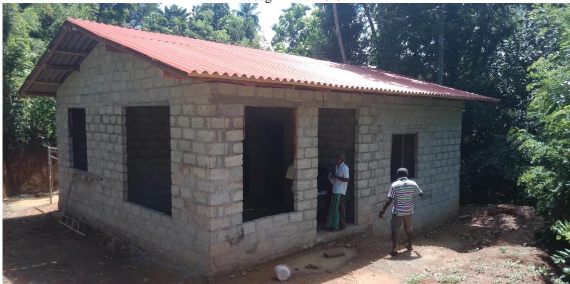
Status Juni 2019