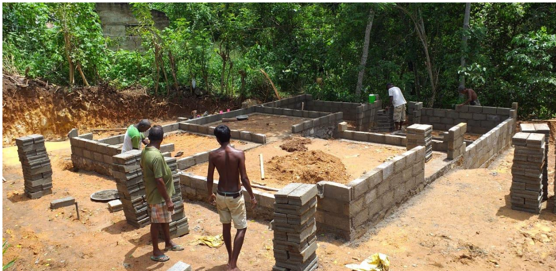
Baubeginn Mai 2019